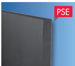
2 Knauf XTherm