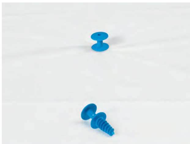
Mise en œuvre de la vis Knauf Spiradal dans chaque panneau de Knauf Therm Dalle Portée Rc50