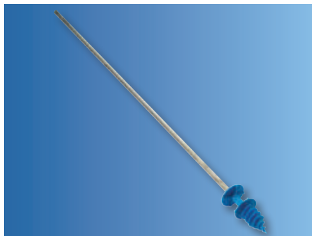
Mise en œuvre de la vis Knauf Spiradal à l'aide de l'embout de vissage