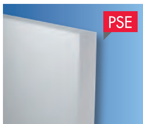
1 Knauf Therm