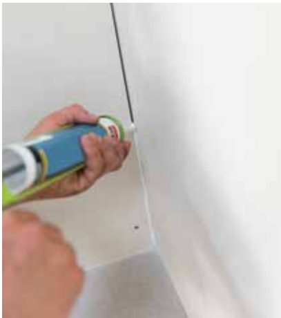
Fig. 3 - Traitement des cueillies, des angles rentrants et des points singuliers à l'aide d'un mastic sanitaire label SNJF