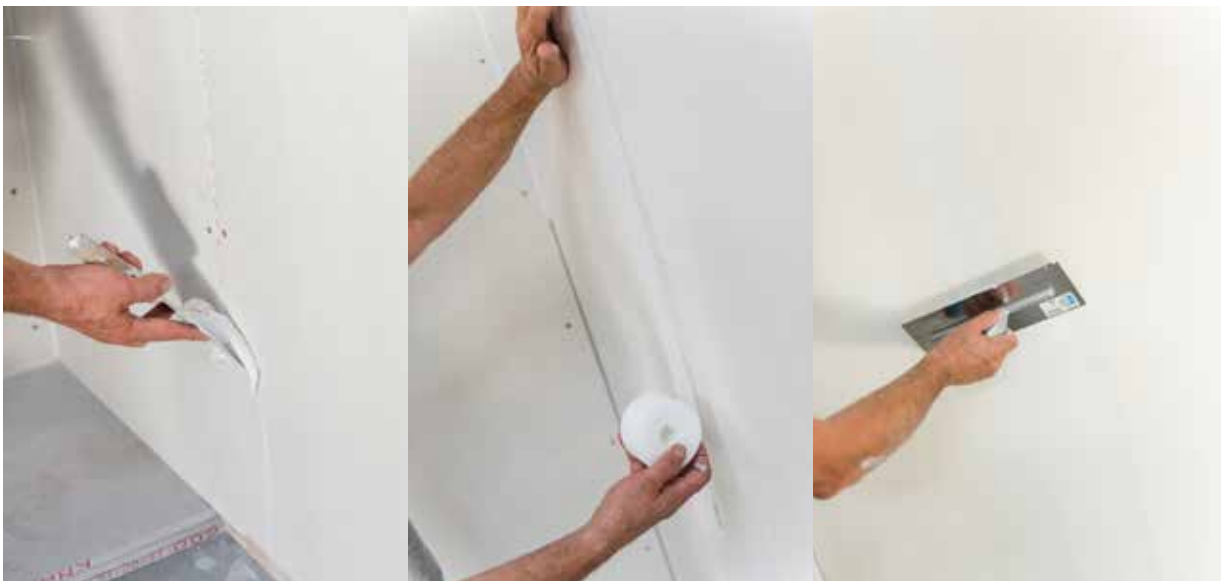
Fig. 4 - Enduisage et mise en place de la bande à joint Knauf HydroProof® avec l'enduit prêt à l'emploi Knauf Proplak® HydroProof® : facile à mettre en œuvre, pour un rendu très blanc et une finition parfaite.