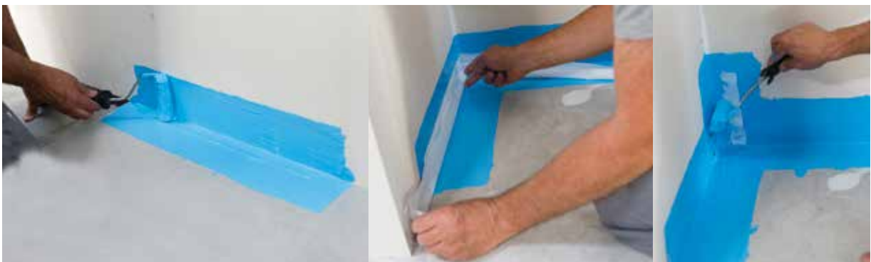
Fig. 5 - Protection des pieds de cloison avec le SPEC Knauf Étanche : Application d'une 1 ère couche de produit dilué. Après séchage, application d'une 2 ème couche de Knauf Étanche non dilué et mise en œuvre de la bande Knauf Étanche. Puis, application d'une dernière couche de Knauf Étanche non dilué.